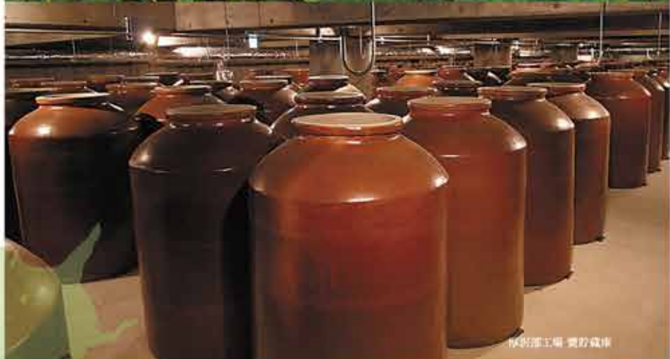
厚沢部工場 発酵蔵庫