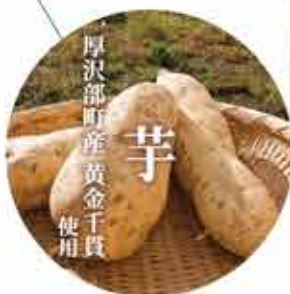
厚沢部町産黄金千貫 芋 使用