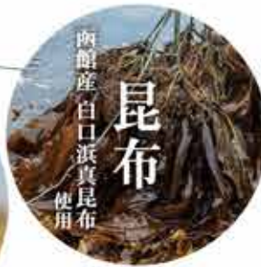
函館産 白口真昆布 昆布 使用