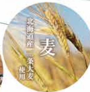
北海道産 二条大麦 麦 使用