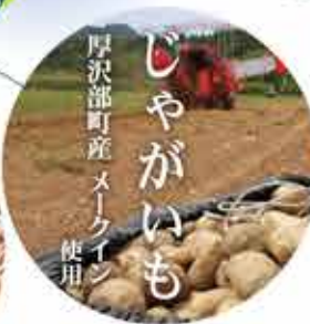
厚沢部町産メークイン じゃがいも 使用