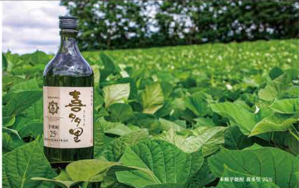
本格芋焼酎 喜多里 25%